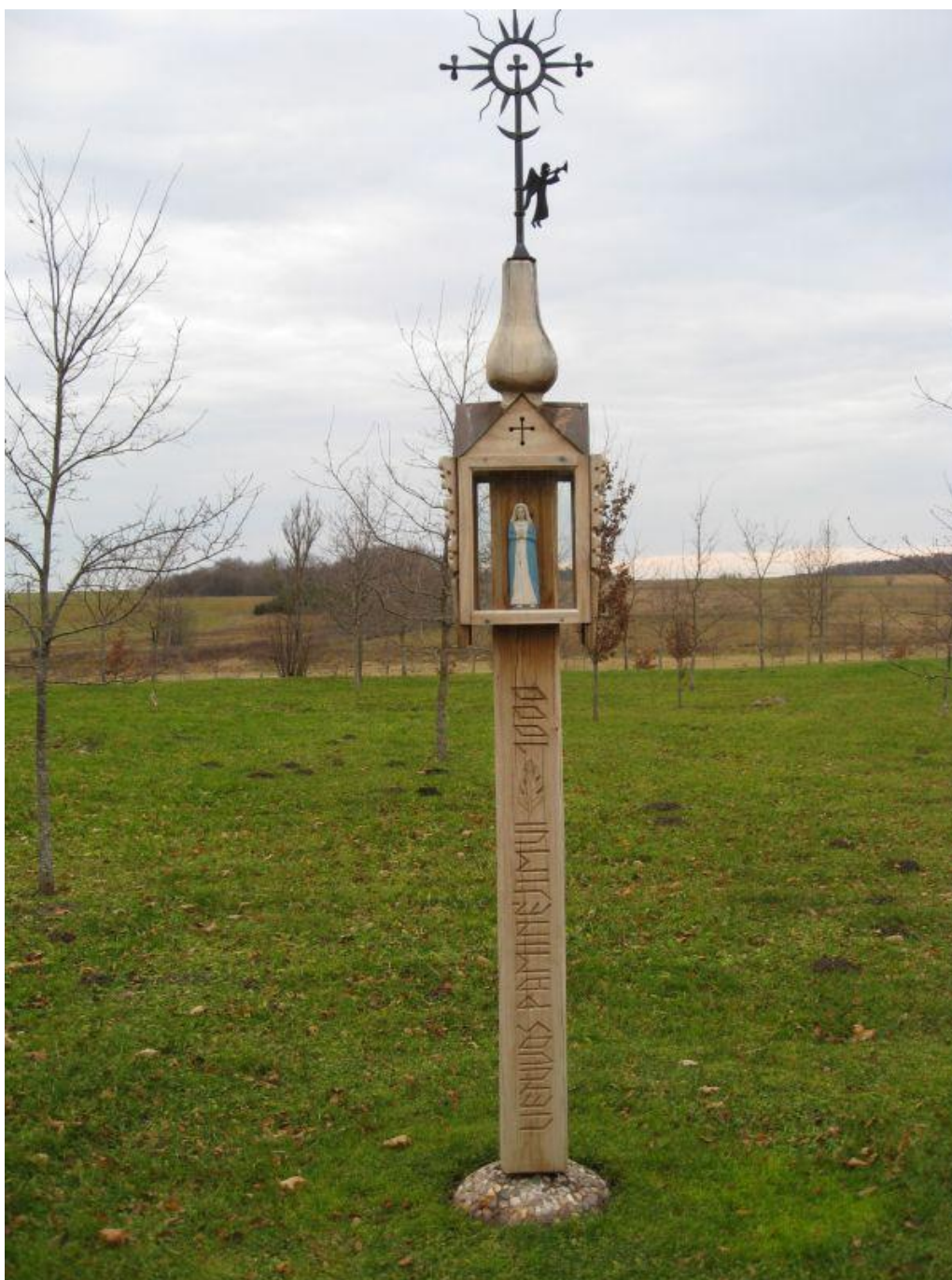
Stogastulpis Lietuvos Vardo Tūkstantmečiui Nasrėnuose, 2010 m.