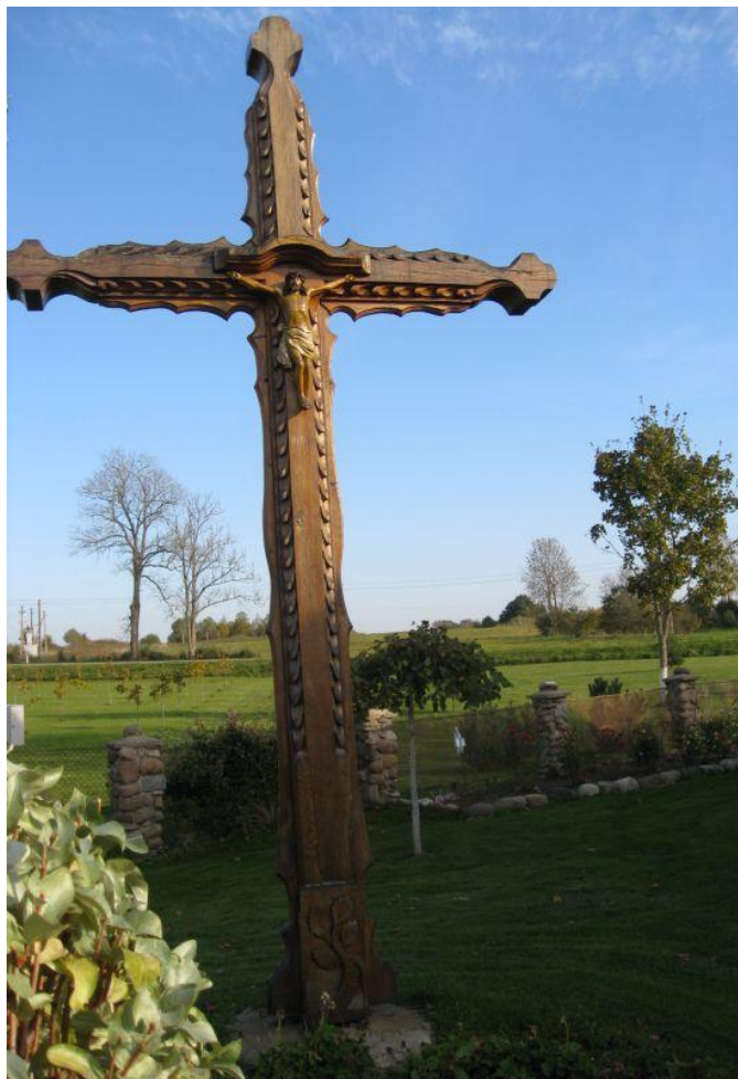
Nasrėnų kaimo kryžius, 2010 m.