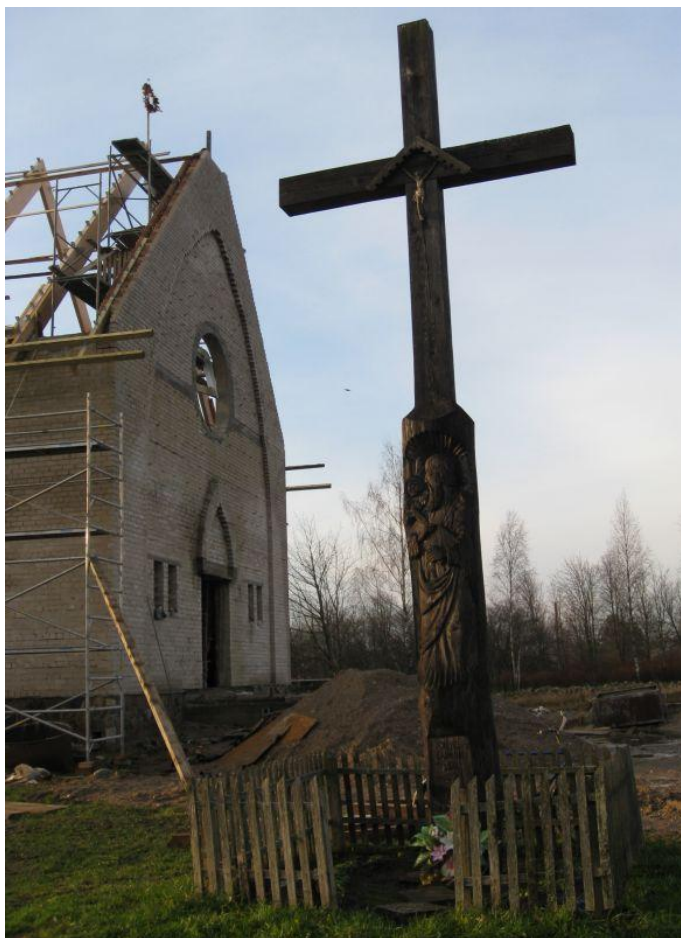
Kūlupėnų bažnyčios kryžius, 2010 m.