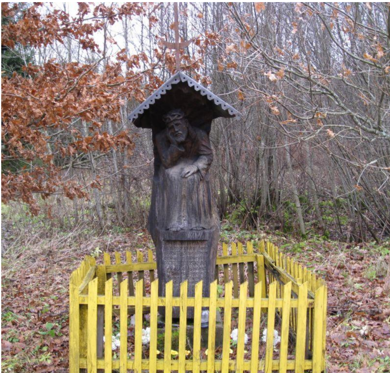
Kūlpėnų kaimo rūpintojėlis, 2010 m.