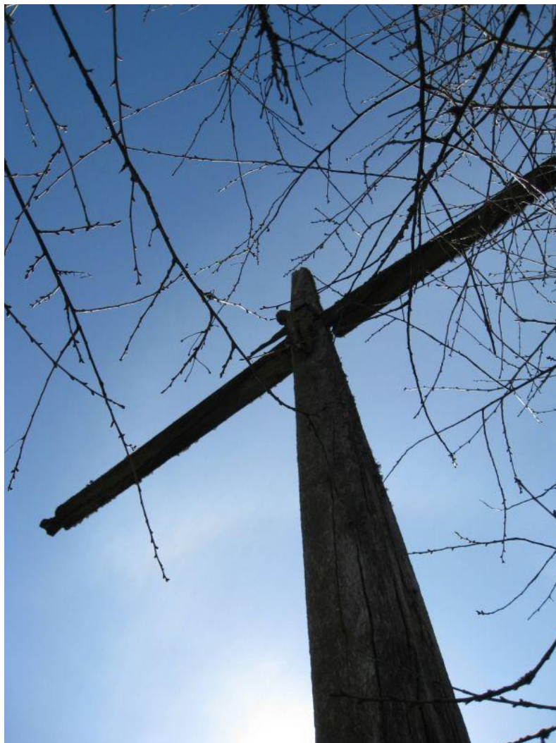
Kryžius Laukų gatvėje, 2010 m.