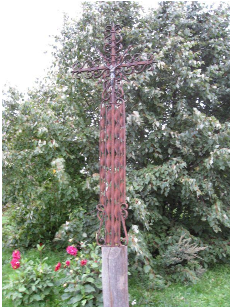
Šatilgalio kaimo metalinis kryžius, 2010 m.