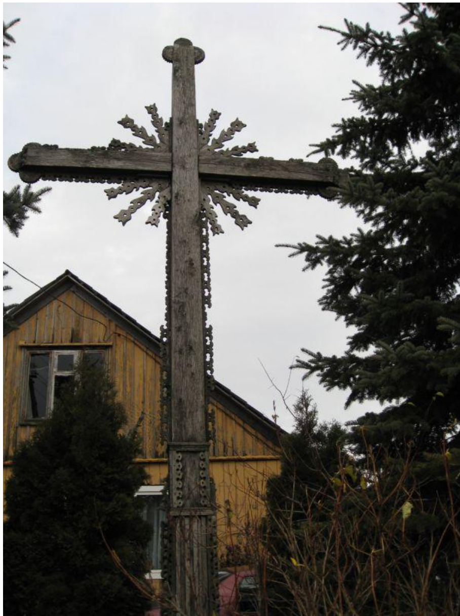
Klausgalvų-Medsėdžių kaimo kryžius, 2010 m.