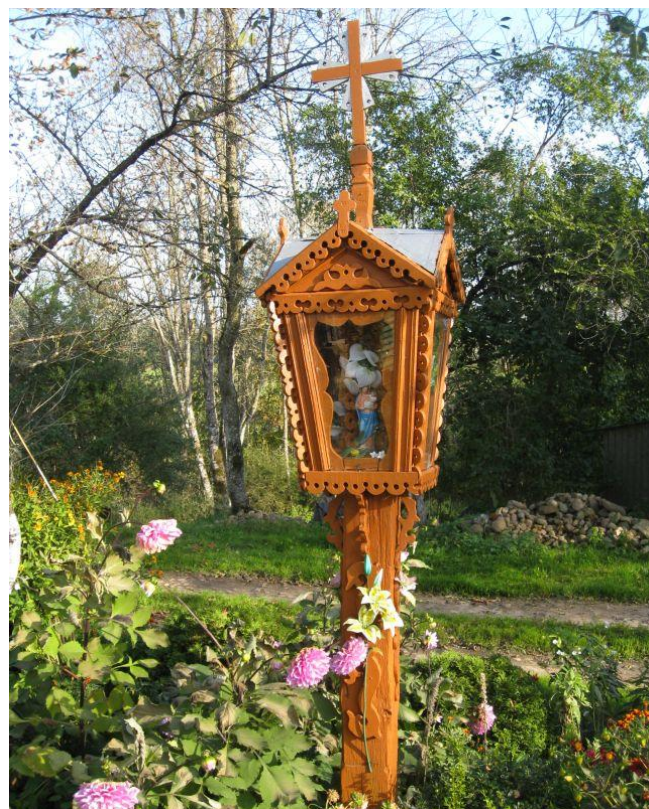
Kryžius ir koplytėlė Šalyno kaime, 2010 m.