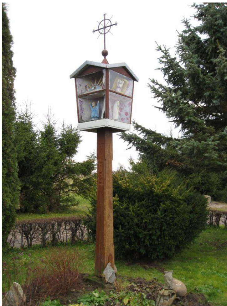
Koplytstulpis Laukų gatvėje, 2010 m.