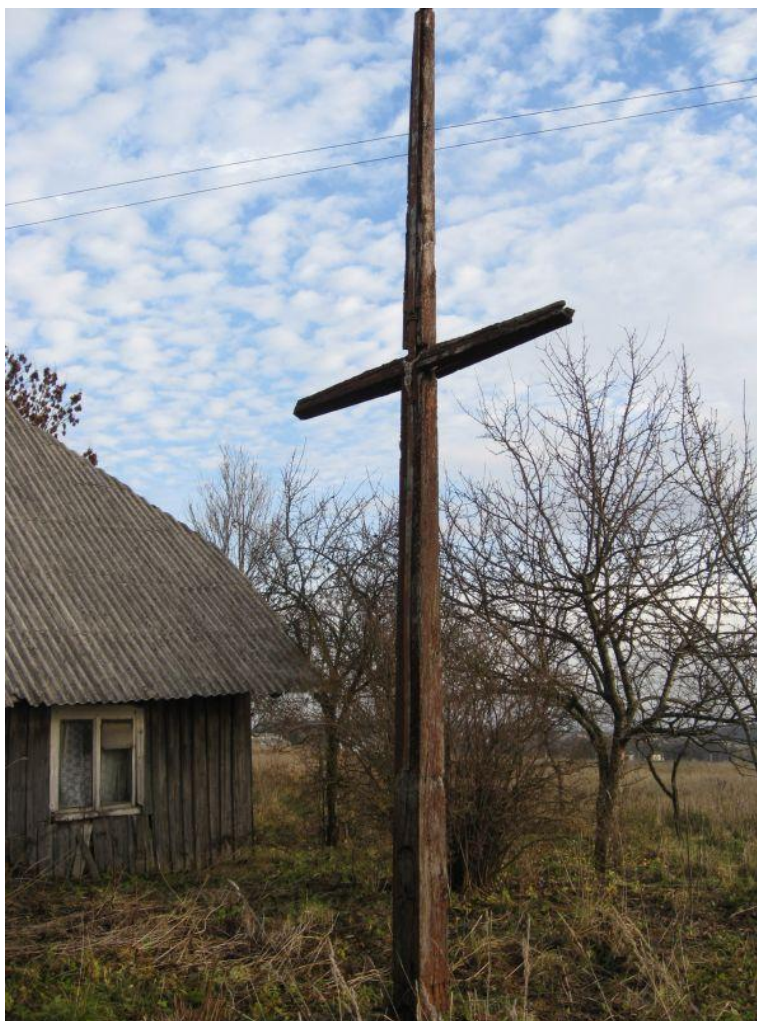
Kryžius Asteikių kaime, 2010 m.