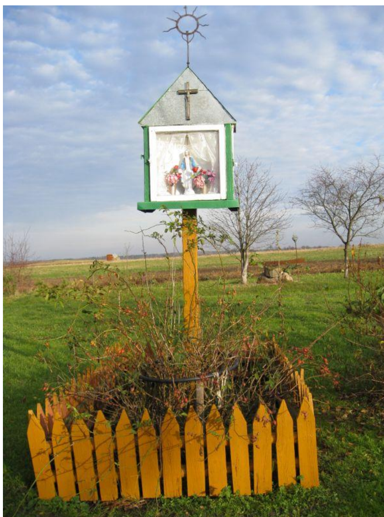
Šatilgalio kaimo koplytstulpis, 2010 m.