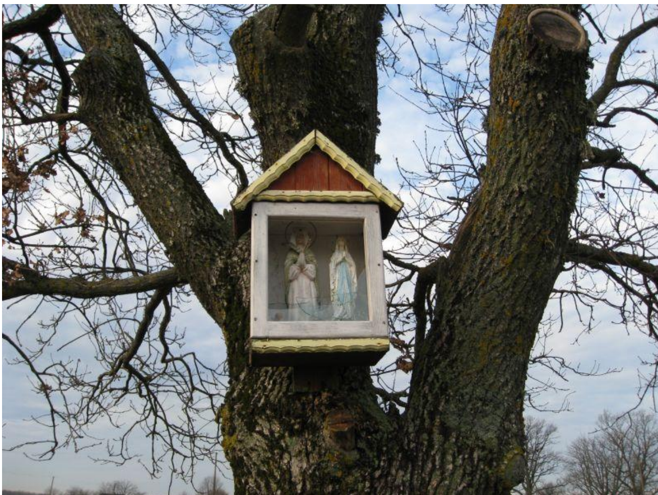
Asteikių kaimo koplytėlė ąžuole, 2010 m.