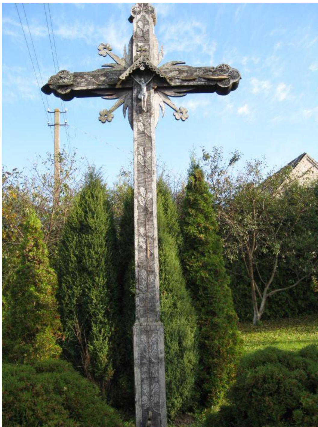
Nasrėnų kaimo kryžius, 2010 m.