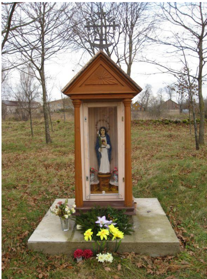
Asteikių kaimo kapelių koplytėlė, 2010 m.