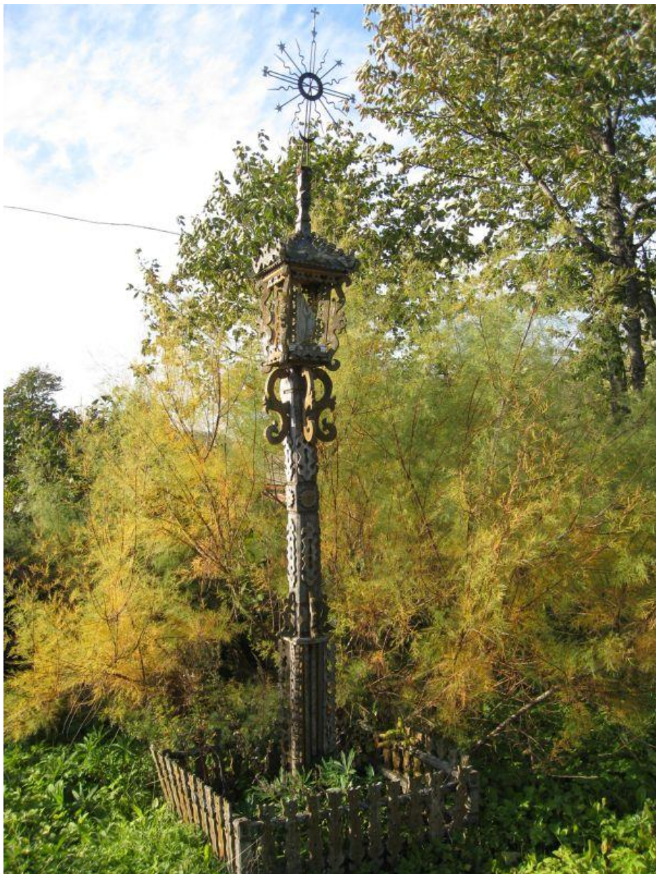
Stogastulpis Nasrėnų kaime, 2010 m.