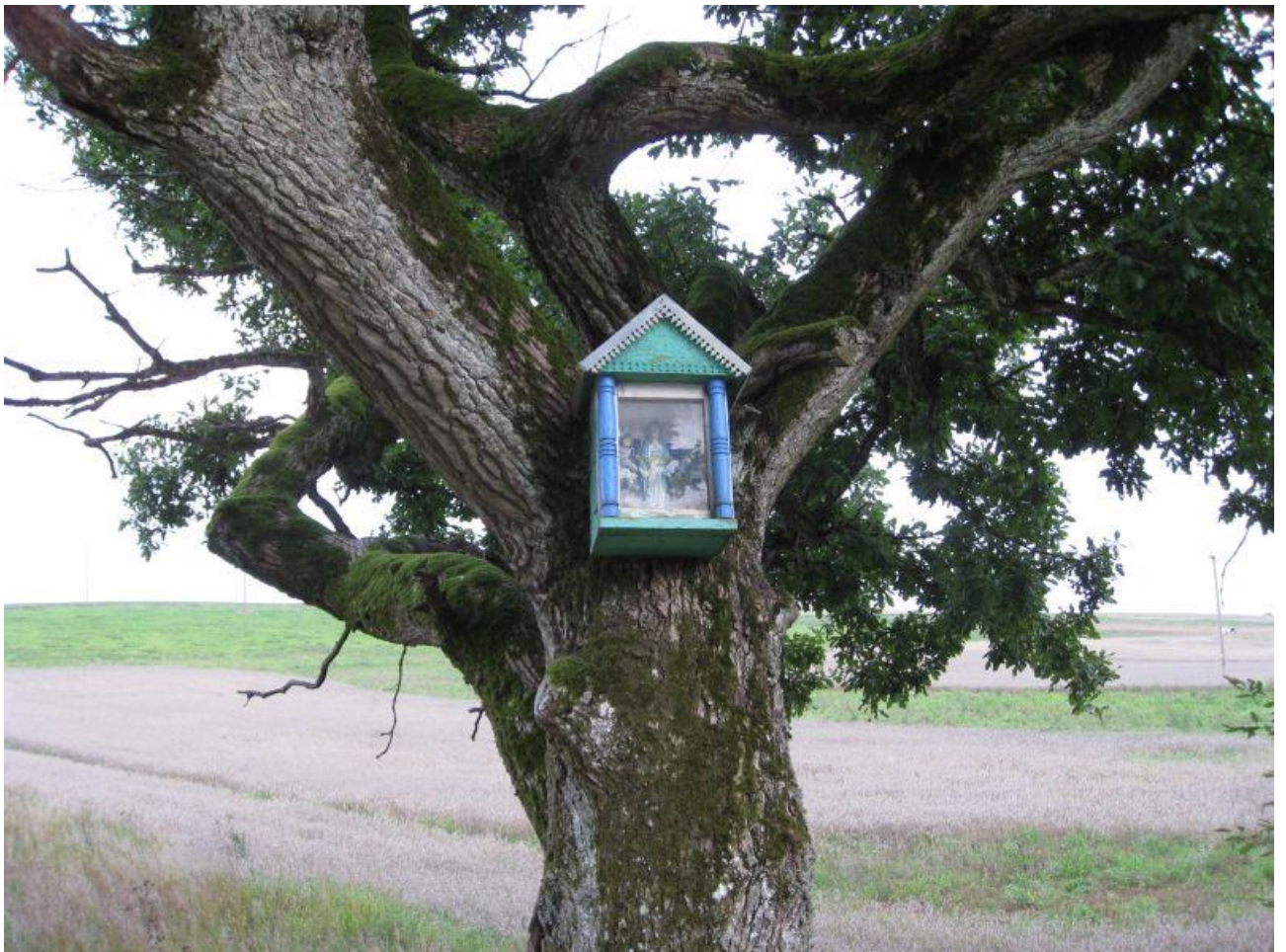
Sauserių kaimo koplytėlė ažuole, 2010 m.