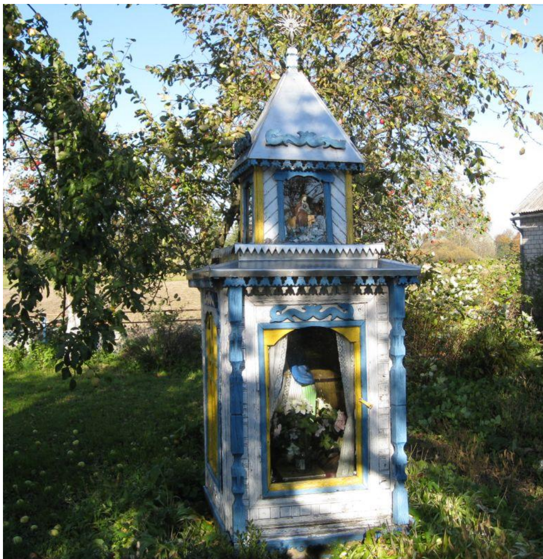
Koplytėlė Klausgalvų-Medsėdžių kaime, 2010 m.