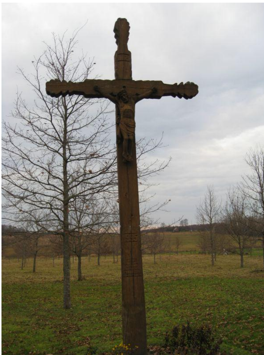
Nasrėnų ąžuolino kryžius, 2010 m.