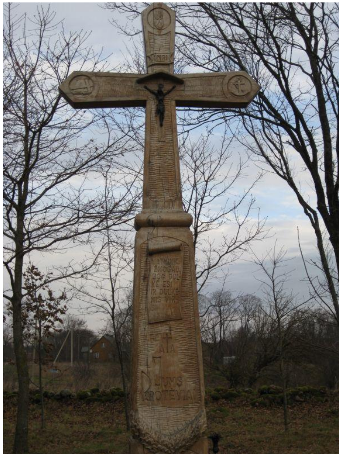
Asteikių kaimo kapelių kryžius, 2010 m.